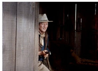
RIO BRAVO.

Serge Daney, Visages du cinéma n°1, 1962