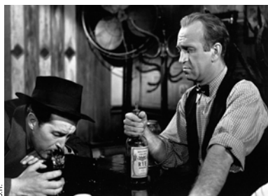
LE POISON.

Premier film hollywoodien sérieux sur le fléau de l'alcoolisme, à tel