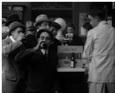
D.R. FOR HIS SON.