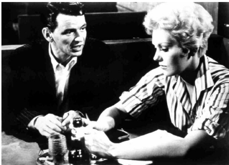
L'HOMME AU BRAS D'OR.

point qu'une compagnie d'alcools avait tenté d'acheter le film à sa sortie pour le détruire ! Ray Milland s'investira à fond dans le rôle refusant pendant un long moment de s'alimenter, comme les alcooliques n'en ont pas le réflexe, et en passant une nuit en tant que patient dans le Bellevue Hospital à New York (il se fera même arrêter par la police pour ivresse sur la voie publique lors du tournage en extérieur à New York).