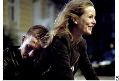
OSLO, 31 AOÛT.

Antoine du Jeu, Les Inrockuptibles , août 2018