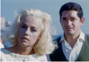
LA BAIE DES ANGES.

> ÉCOLES CINÉMA CLUB 23, rue des Ecoles Paris 5 e