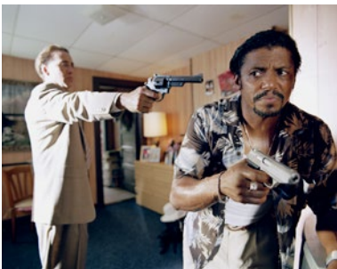
BAD LIEUTENANT, ESCALE À LA NOUVELLE-ORLÉANS.