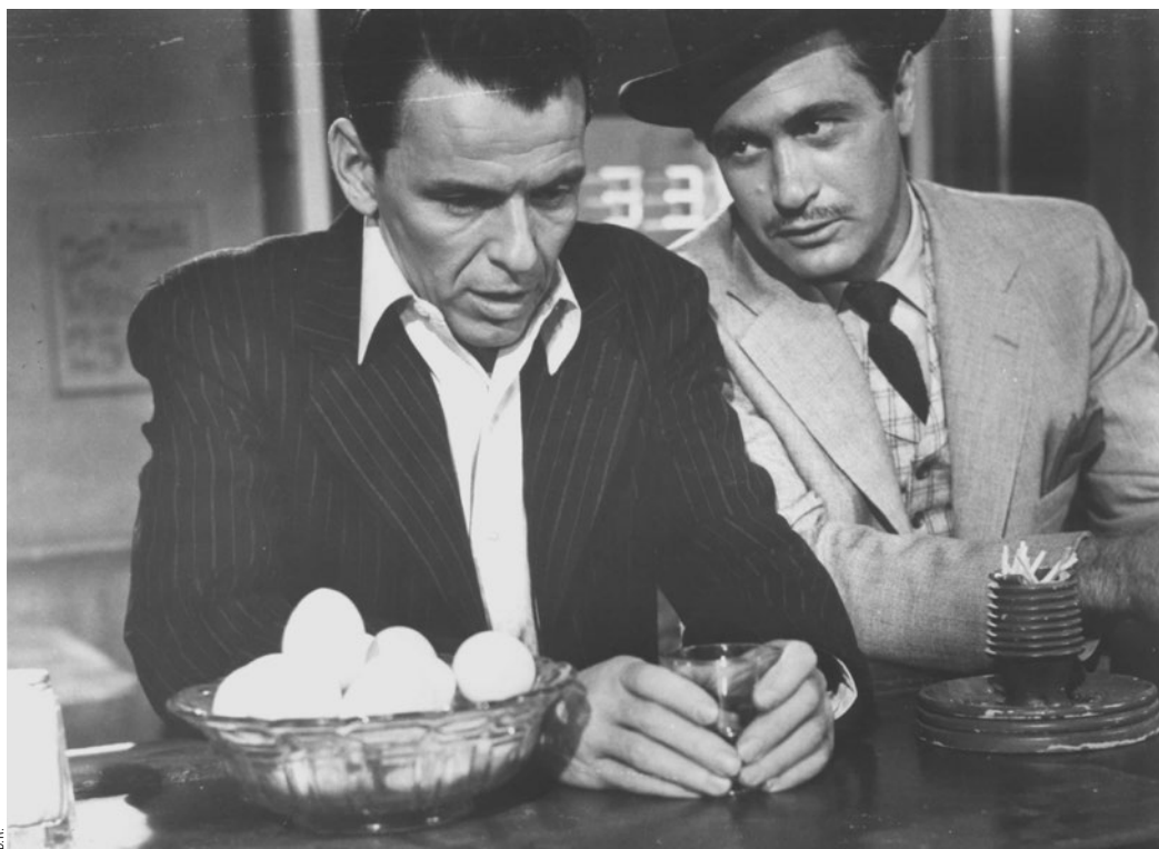
L'HOMME AU BRAS D'OR, OTTO PREMINGER, 1955.